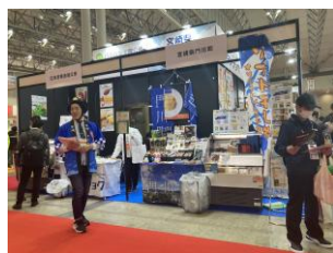
SMTS 2024 (4小間/8社出展)