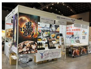
フードスタイル九州 2024 (2小間/4社出展)