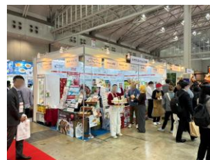
SMTS 2026 (2小間/9社出展)