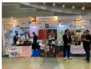
SMTS 2025 (2小間/8社出展)